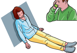
ou position assise si difficulté respiratoire